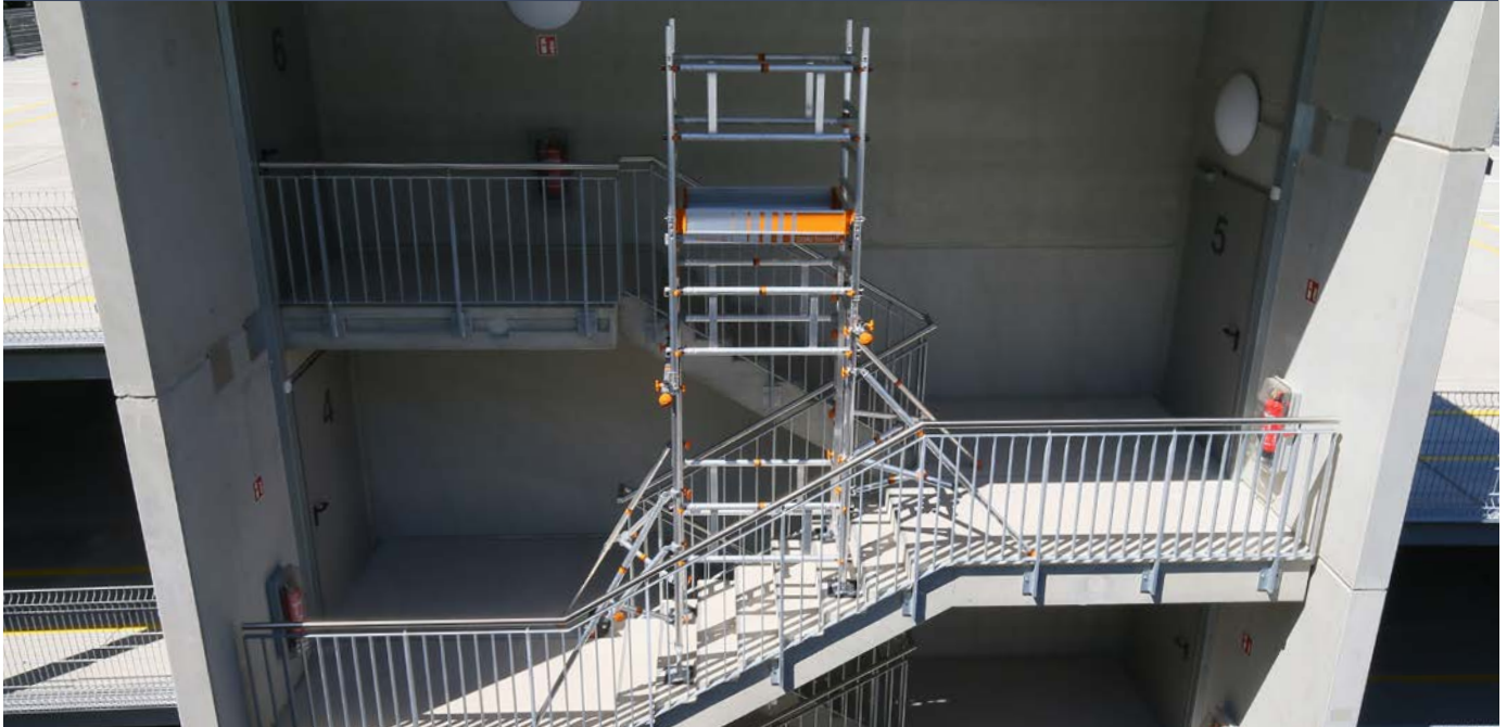
SoloTower mit Treppen-Kit Lösung