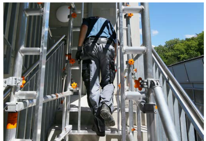
Einsatz SoloTower mit Treppen-Kit – baustellentaugliche Durchgangswege

Das Treppen-Kit ist ab dem Spätsommer auch für das Uni Standard und das Uni Leicht verfügbar.